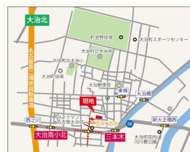
カーナビ検索 愛知県海部郡大治町三本木寒宿 5

現況と異なる場合には現況を優先します。 該当物件が建築条件付き宅地だった場合、土地売買契約締結後3カ月以内に売主と住宅の建築請負契約を締結していただくことを条件として販売いたします。 この期間内に住宅を建築しないことが確定したとき、または住宅の建築請負契約が成立しなかった場合は、土地売買契約は無効となり、 受領した金額は全額無利息でお返しします。